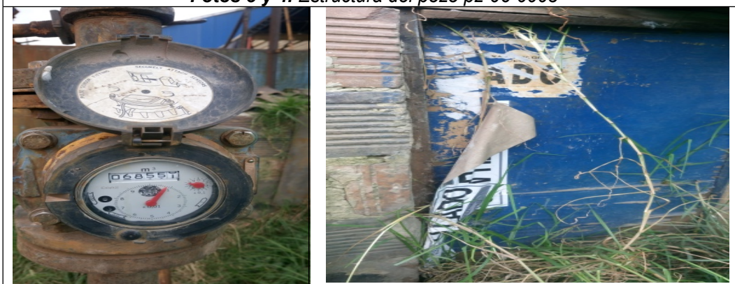
Foto 5. Vista del medidor con serial 03W165277 lectura de 68550,80m 3