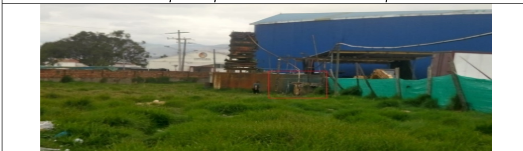
Foto 2. Ubicación del pozo en el potrero trasero del predio (cuadro rojo).