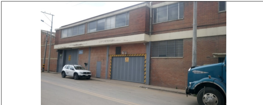
Foto 1. Fachada del predio que cuenta con tres entradas por la carrera 61.

No fue posible identificar si el sistema de extracción estaba habilitado y en disposición de entrar en funcionamiento dado que no es posible entrar al cuarto donde se encuentra el sistema eléctrico de la bomba sumergible por encontrarse trabada la puerta y con sellos de la entidad.