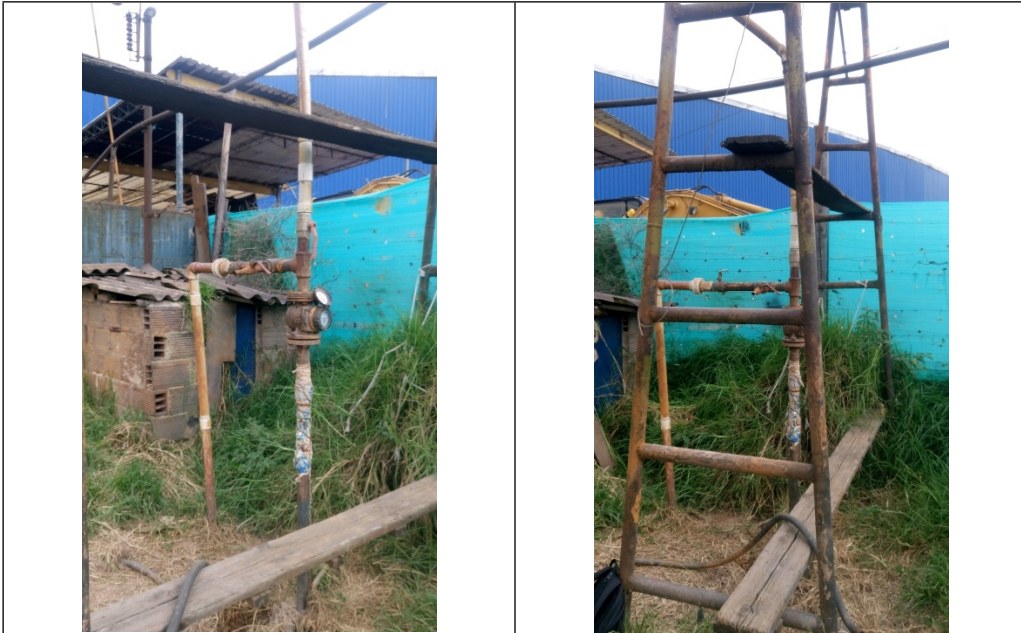
Fotos 3 y 4. Estructura del pozo pz-06-0003