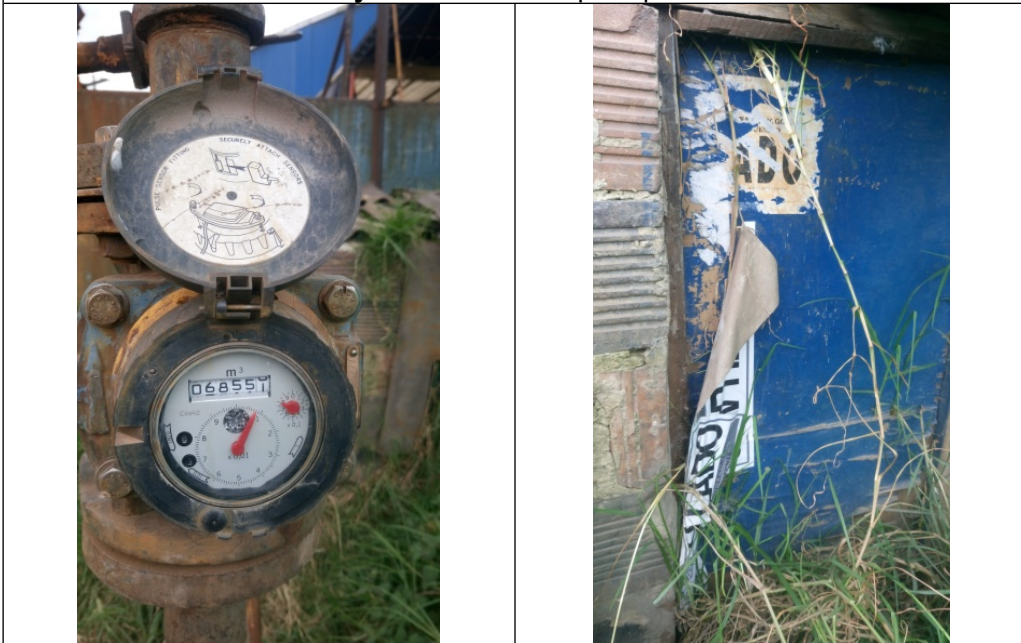
Foto 5. Vista del medidor con serial 03W165277 lectura de 68550,80m 3