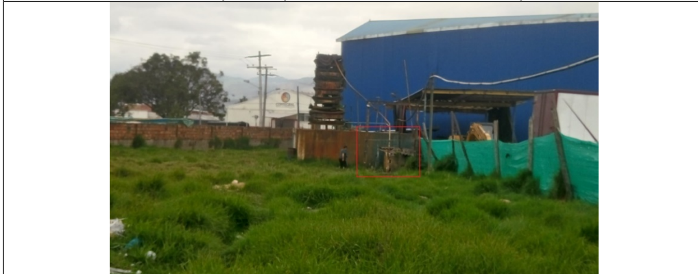
Foto 2. Ubicación del pozo en el potrero trasero del predio (cuadro rojo).