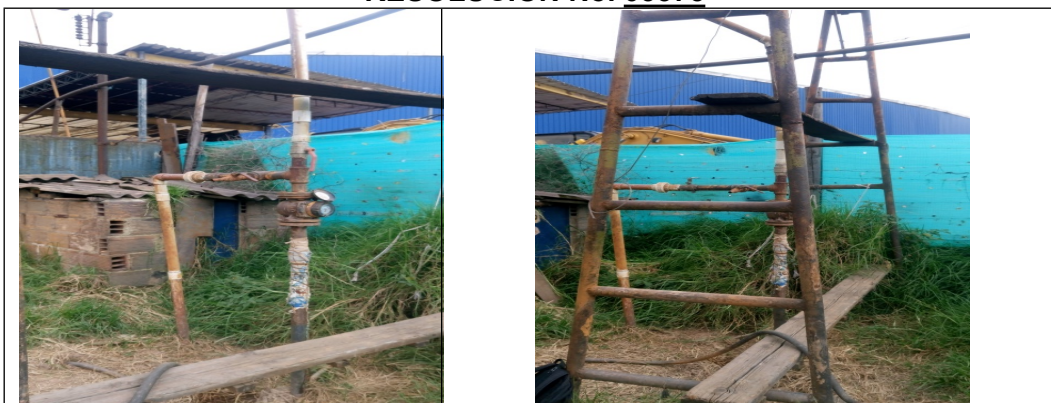
Fotos 3 y 4. Estructura del pozo pz-06-0003