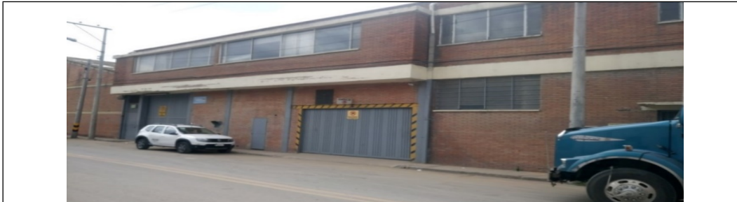
Foto 1. Fachada del predio que cuenta con tres entradas por la carrera 61.

No fue posible identificar si el sistema de extracción estaba habilitado y en disposición de entrar en funcionamiento dado que no es posible entrar al cuarto donde se encuentra el sistema eléctrico de la bomba sumergible por encontrarse trabada la puerta y con sellos de la entidad.